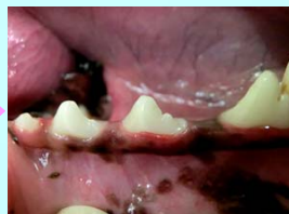
スケーリング (歯垢・歯石除去)