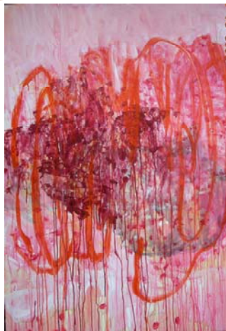
作品解説 作品タイトル： 「winter work for spring」 サイズ： 145cm×103cm 技法： 板にアクリル絵具 最近では、全くの抽象を描いて おります。絵具を垂らすのが、 痛快です。春のイメージです。