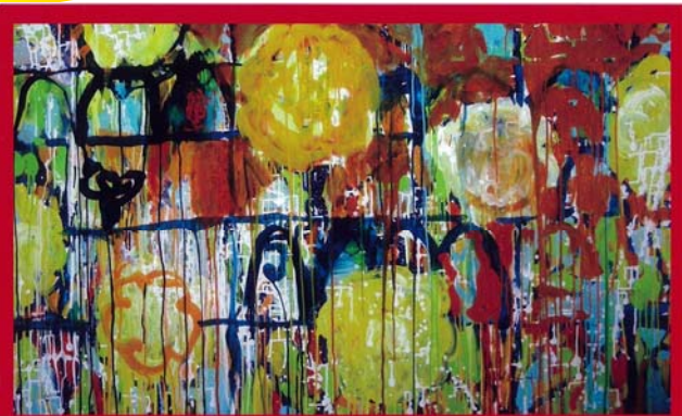
NORIHICO SABURI EXHIBITION