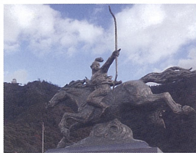
▲若き日の織田信長像(後ろに岐阜城)

岐阜城は古くは稲葉山城と呼ばれ、明智光秀が仕えた斎藤道三、織田信長が城主でした。斎藤道三の息子、斎藤義龍は、光秀が歴史の表舞台に出てくる10年以上前(1556年)に、明智城(可児市瀬田)を攻め落城させたとされており。織田信長は、この稲葉山城に移ってからそれまでの地名「井口」を「岐阜」と改めて、天下布武を発し、楽市楽座を行いました(歴史で有名ですね)。大河ドラマ館と併せて、岐阜城に行くのがお勧めです。岐阜城は山城のためロープウェイが整備され、麓の茶屋には疲れを癒す五平餅が売られています。