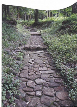
こんな感じで 石畳がひかれています。