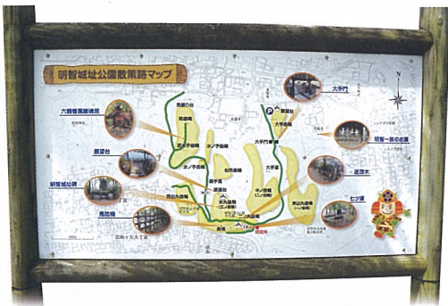
← 明智城址公園散策マップ