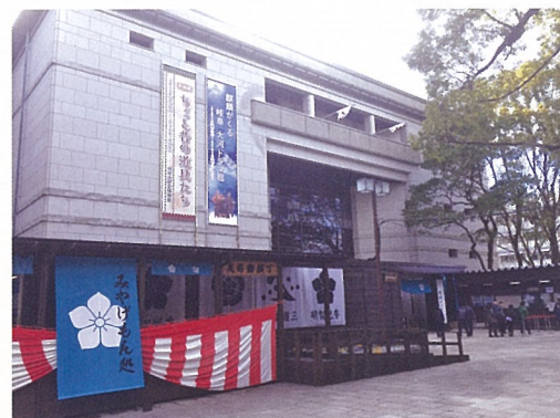
▲岐阜大河ドラマ館(岐阜市歴史博物館)

大河ドラマ館は、岐阜に3か所(岐阜市、恵那市、可児市)と京都府亀岡市の合わせて4か所あり1年間限定でオープンします(京都府福知山市はミュージアム、滋賀県大津市はびわ湖大津・光秀大博覧会としてオープン)。期間が1年間もあるので、制覇することは簡単ですね。