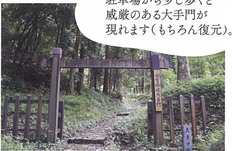
駐車場から少し歩くと 威厳のある大手門が 現れます(もちろん復元)。