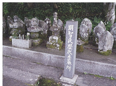
天龍寺の敷地内にある明智一族の墓所

天龍寺内にまつられている日本一大きな明智光秀の位牌。横には光秀の木像があります。