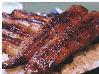
桜屋HP (※写真はイメージです)

いつもNBR timesをご愛読いただきましてありがとうございます。おかげさまで2011年から続くNBR timesは今回でVol. 30を迎えることができました!(拍手!)