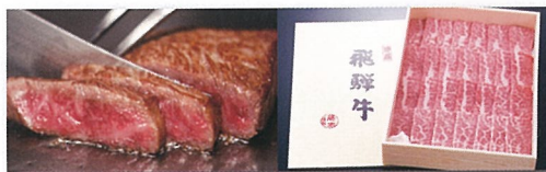
株式会社藤太HP (※写真はイメージです)