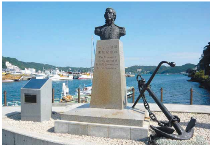
ペリー上陸記念碑

なお、修善寺と下田には同系列のレンタカー営業所がありますので、行きは車、帰りは鉄道で移動することが可能です。修善寺分室においての際には、スケジュールを1日余分にとり、観光してみても如何でしょうか