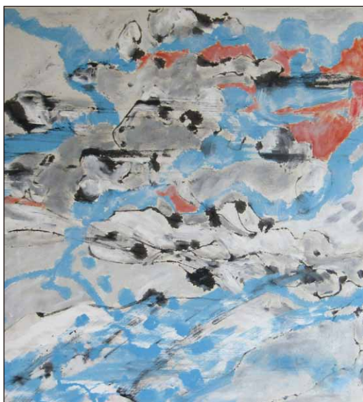
【sky】 90cm×90cm 綿布に油彩