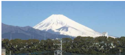
新幹線の車窓から