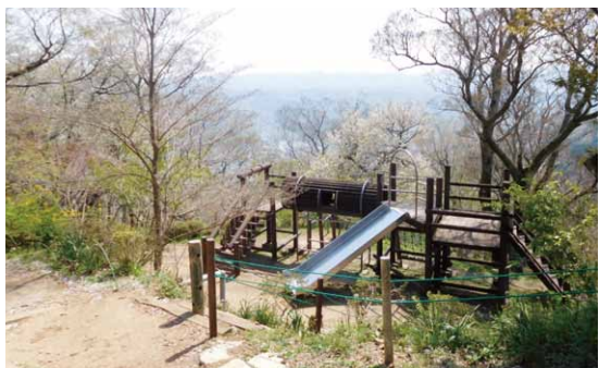
山頂のアスレチック