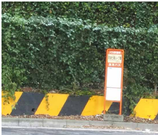
河津七滝ループ橋バス停