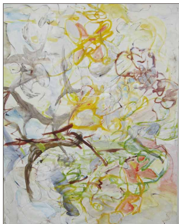
【tree】 F30号 キャンバスに油彩

この4月からご縁をいただきまして、富山県で仕事をしております。岐阜で描いていて煮詰まっていた作品が不思議なことに仕上がってきました。この3点は岐阜の川、空、樹などの自然からインスピレーションを得て描き始めました。制作途中で進まなくなっていました。距離ができたことで、岐阜に対して、いろいろな思いが少し整理されたようです。かつて、故郷を追われてその郷愁を描いていたシャガールの気持ちがほんの少しだけ分かるような気がしています。家族で過ごす時間が減った分、私の日常は味気のないものになっています。娘と散歩をしながら気になる色やかたちを見つける時間もなかなかありません。となれば、また違う作品ができてくるのではないかとも思ったりします。上手に描こうという気はさらさらなく、こう描かなくてはというものもなくなりました。自分のスタイルすら捨てて、どんどん作品が解放されていきます。描き続けるしかありません。