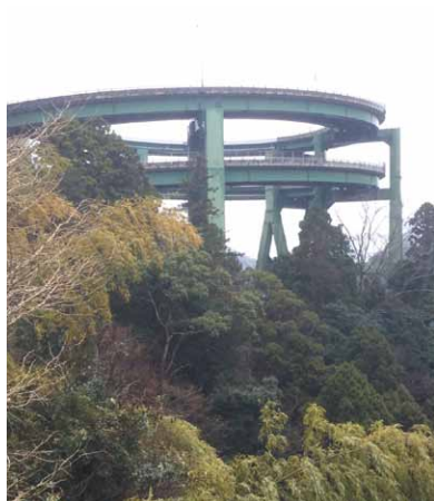
河津七滝ループ橋