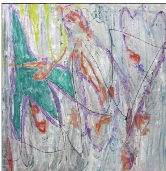
【river】 60cm×60cm 板に油彩