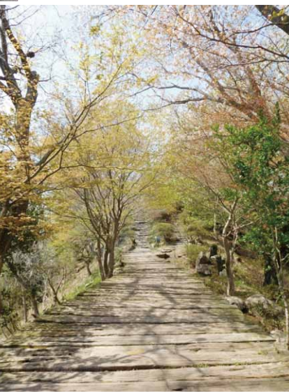
散歩コース途中のボードウォーク