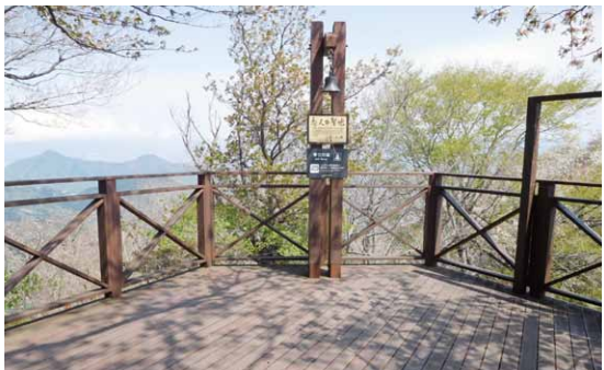
恋人の聖地の象徴「幸せの鐘」