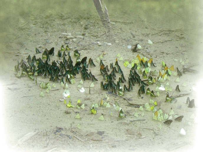
▲蝶の集団吸水（マレーシア）