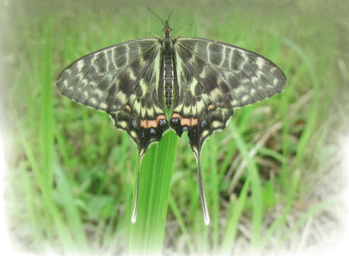
▲ホソオチョウ（オス）